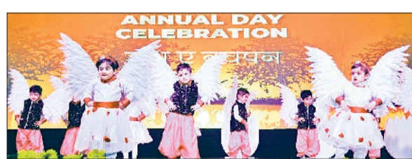
रेवाड़ी। राज स्कूल में सांस्कृतिक कार्यक्रम पेश करते बच्चे।

मंत्रमुग्ध किया। इस दौरान केबीसी के सवालोंने भी सबकी उत्सुकता को बढ़ाया, जिसमें अभिभावकों ने बढ़-चढ़कर भाग लिया। विद्यार्थियों ने सपनों की उड़ान व जश्न ए बचपन थीम पर शंकर जी का डमरू