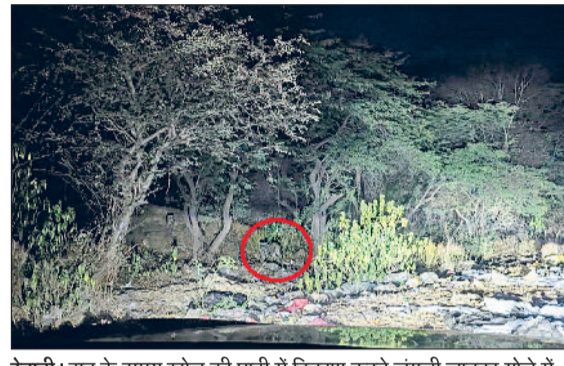
रेवाड़ी। रात के समय खोल की घाटी में विचरण करते जंगली जानवर गोले में और पड़े कूड़े के ढेर।

पर प्रतिबंध के बाद इस कचरे से तो निजात मिल गई, लेकिन अब आम लोग अरावली वन क्षेत्र को अस्थायी डंपिंग यार्ड के रूप में इस्तेमाल कर रहे हैं। खासकर जिन पहाड़ों के आसपास से सड़क व आम रास्ते निकले हुए हैं, वहां भारी मात्रा में कचरा पहाड़ों और वन क्षेत्र के बीच डाला जा रहा है। इससे एक ओर जहां पेड़-पौधों को नुकसान हो रहा है, तो दूसरी ओर जंगली जानवर भी इसका शिकार हो रहे हैं।