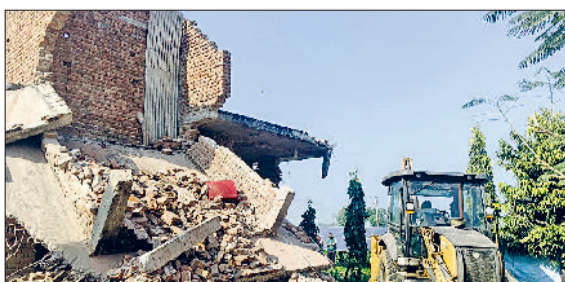
रेवाड़ी। कोसली क्षेत्र में अवैध निर्माण तोड़ती जंजीबी।

डीटीपी विभाग की टीम ने मंगलवार को कोसली की राजस्व सीमा में अवैध निर्माणों पर तोड़फोड़ की कार्रवाई की। पुलिसबल की मौजूदगी में डीटीपी की कार्रवाई का कहीं