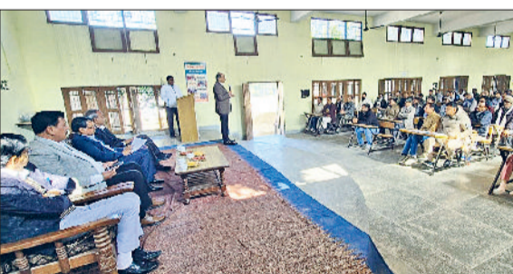
रेवाड़ी। नाहड़ खंड के स्कूलों मुखियाओं को दिशा-निर्देश देते डीईओ।