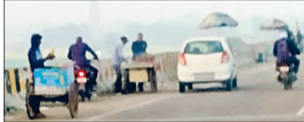
रेवाड़ी। झंजर की ओर जाने वाले बाइपास पर खड़ी रेहड़ियां।

रेवाड़ी। जैसलमेर नेशनल हाइवे से झंजर रोड को जोड़ने वाले आउटर बाइपास के टी-प्वाइंट के पास रेहड़ी वालों ने कब्जा जमा लिया है। बड़ी संख्या में रेहड़ियां खड़ी होने के कारण कोहरे के समय हादसों की आशंका बढ़ रही है। पहले रेहड़ी लगाने वाले लोगों ने नाईवाली चौक फ्लाईओवर के नारंगी की ओर जाने वाले हिस्से पर कब्जा जमाया हुआ था। इससे पुल पर जाम जैसे हालात बने रहते थे। ट्रैफिक पुलिस ने इस स्थान से रेहड़ियों को हटवा दिया था। अब इन रेहड़ी वालों ने बाइपास पर कब्जा जमा लिया है। हरिनगर के पास टी-प्वाइंट पर झंजर की ओर जाने वाले रोड पर दूर तक रेहड़ियां खड़ी की जा रही हैं। इन रेहड़ियों के कारण फ्लाईओवर का एक हिस्सा ही मिनी मार्केट की तरह बनने लगा है। रेहड़ियों पर सामान खरीदने के लिए लोग सड़क पर ही अपने वाहन खड़े कर देते हैं, जिससे बाइपास रोड से दूसरे वाहनों को निकलने में परेशानी का सामना करना पड़ता है। शाम के समय पुल पर रेहड़ियों कारण लोगों की भीड़ एकत्रित हो जाती है।