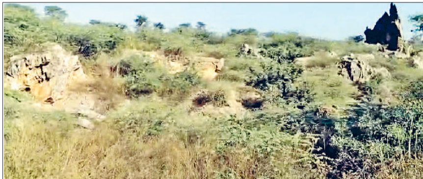
रेवाड़ी। खनन के दौरान अस्तित्व खोने के कगार पर पहुंचा जाटसाना का पहाड़।

अरावली पर्वत माला के अस्तित्व पर सुप्रीम कोर्ट के फैसले से छाप संकट को खुद सुप्रीम कोर्ट ने फिलहाल टाल दिया है, परंतु पर्वत श्रृंखलाओं के बीच डाले जा रहे कचरे ने पर्यावरणीय खतरे को बढ़ाया हुआ है। अरावली की पहाड़ियों के बीच भारी मात्रा में कचरा डाला जा रहा है, जो पर्यावरण के साथ-साथ जंगली जानवरों के लिए भी बड़ा खतरा बन गया है। जिले के कई किलोमीटर एरिया में अरावली की पर्वत श्रृंखलाएं फैली हुई हैं। इनमें सबसे अधिक कुंड के आसपास के एरिया में हैं। अरावली पर्वत श्रृंखलाओं पर लाखों पेड़-पौधे हैं, जो पर्यावरण